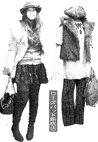
ローズパッド新宿店