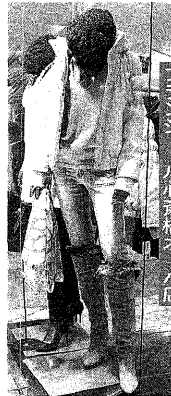
ブランシュール心斎橋オーバ店