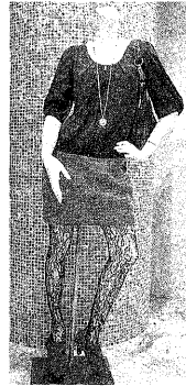
フリーズショップルミネ新宿店

⑩販売を強める素材が合皮のダウンジャケット2万2050円、ピンクのVネックセーター6300円、ジーンズ1万4490円、すべて「ブランシュール」⑪売れ筋のバラ柄ワンピース1万4490円、セーター6300円、ともに「ブランシュール」