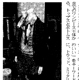
フリークスタナシヨルフリークスタナシヨル