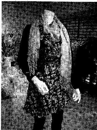
カエニ・インターナショナルカエニ

「プレッピー」感覚... ユナイテッドローズ... カエニ・インターナショナルカエニ... ユナイテッドローズは、オーストラリアの高級ブランドで、ミリタリーやプレッピーの雰囲気を醸成している。