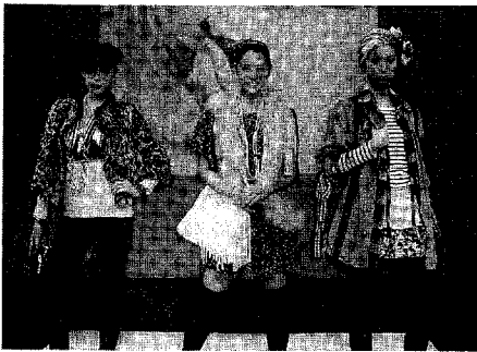
三陽商会「ファビュラス・クローゼット」