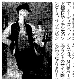
フリークスタナシヨルフリークスタナシヨル

「プレッピー」感覚... ユナイテッドローズ... カエニ・インターナショナルカエニ... ユナイテッドローズは、オーストラリアの高級ブランドで、ミリタリーやプレッピーの雰囲気を醸成している。